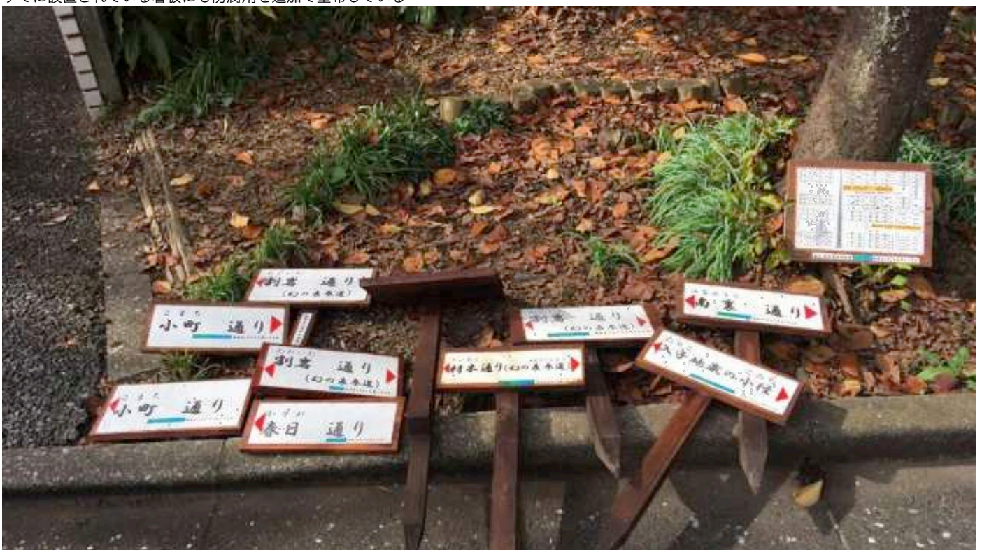
新しく製作した看板（栗の板に柿渋と防腐剤塗布）