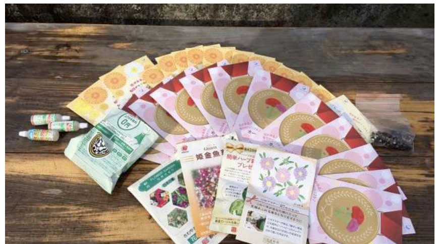
たねぼすに入っていた種

昨年同様コロナ禍においても公園の整備は続けてきました。 又、今年設置したたねぼすについても市民の方にご協力頂きたくさんのたねが集まりました。 集まった種を生かすため、種をまける場所を探していくのが今後の課題です。