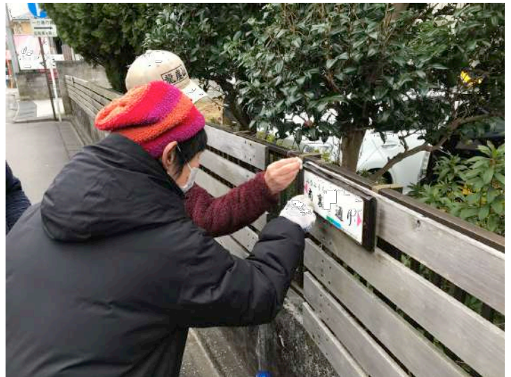
すでに設置されている看板にも防腐剤を追加で塗布している