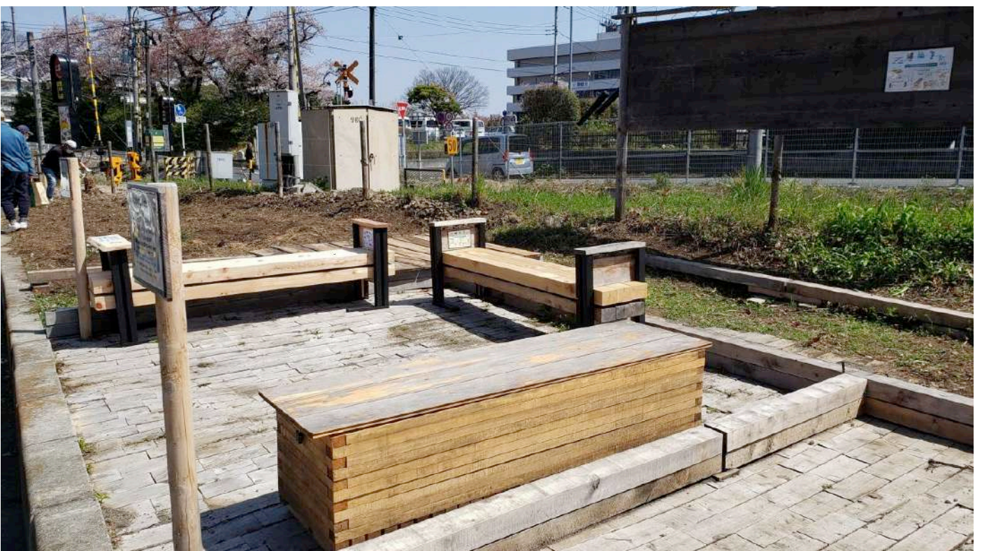
整備作業後の様子